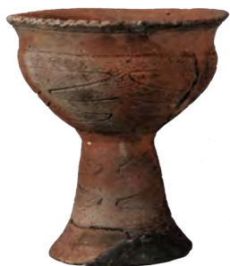
龍門寺式土器の高杯 (龍門寺遺跡 いわき市平上荒川)