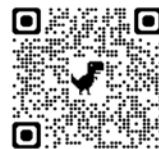
申込 QR コード

参加者には「考古ガチャ」で、 「いわきの考古 缶バッジ」 からひとつを差し上げます!