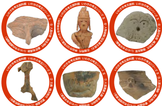
いわきの考古 缶バッジ (全6種類)

参加者には「考古ガチャ」で、 「いわきの考古 缶バッジ」 からひとつを差し上げます!