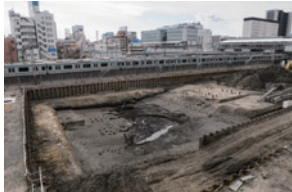
JRいわき駅北口で検出された警城平城の外堀跡。同駅の南側で屈曲し、同駅前再開発ビル「ラトプ」の方向に続く。

本展では、発掘調査の成果から江戸時代の警城平城本丸跡や田町曲輪、戦国時代の遺構を紹介いたします。