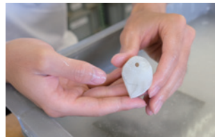
体験学習会の様子。まが玉づくり(上写真)と土器づくり(右写真)。