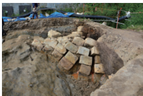
白蛇堀内に崩落した警城平城本丸の石垣。

本展では、平城跡、古身遺跡(勿来町)など令和6年度に実施した市内遺跡の発掘調査成果を紹介いたします。