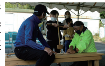
火おこし体験の様子