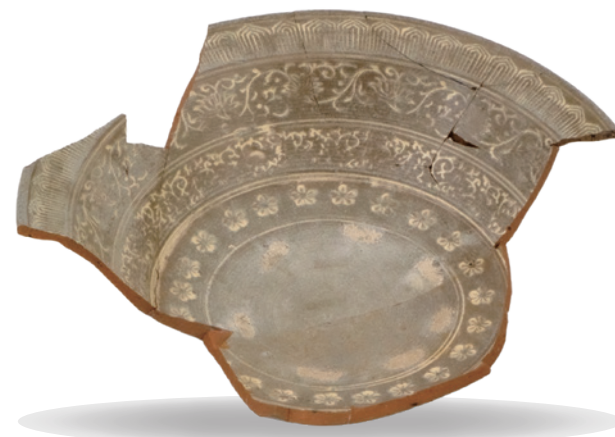
三島唐津鉢 平城跡(いわき市平並木の杜)出土