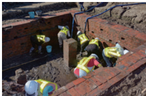
JRいわき駅操車場跡地で検出された煉瓦積み貯水施設。明治30年に開業した旧平駅の施設と推定される。

本展では警城平城廃城から明治時代に至る出土品をもとに近代警城平の歩みを紹介します。